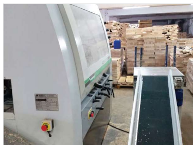
Avtomatski povratek obdelovancev iz stroja.