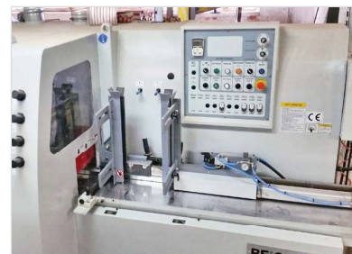
Avtomatska podajalna naprava.